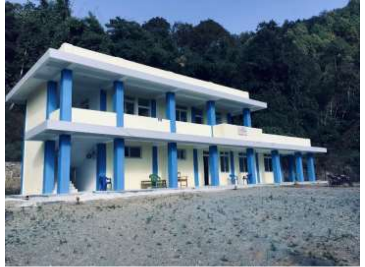
मुलपानी स्वास्थ्य चौकी, बागलुङको नवनिर्मित भवन

बडिगाड गाउँपालिका वडा-०८ खोलाखर्क, बागलुंगमा विधालय स्तरमा जुकाको औषधि खुवाउने कार्यक्रम सम्पन्न भएको छ। साथै स्वास्थ्य आमा समुहको बैठकमा बालभिताको बारेमा छलफल गरिएको थियो। सो अबसरमा २ वर्ष मुनिका बालबालिकाको तौल अनुगमन गरि नियमित तौल अनुगमन गर्न ल्याउने बालबालिकालाई प्रोत्साहन स्वरूप अण्डा वितरण गर्नुको साथै खाद्यान्न प्रदर्शनीमा फर्सिको खिर बनाउने तरिका सिकाई सम्पन्न गरिएको छ।