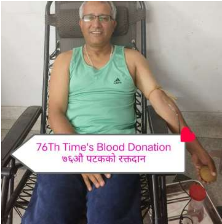
76Th Time's Blood Donation ७६औं पटकको रक्तदान

अंक १७०, वर्ष ५, २०८० मङ्सिर २४, December 10, 2023 आइतबार