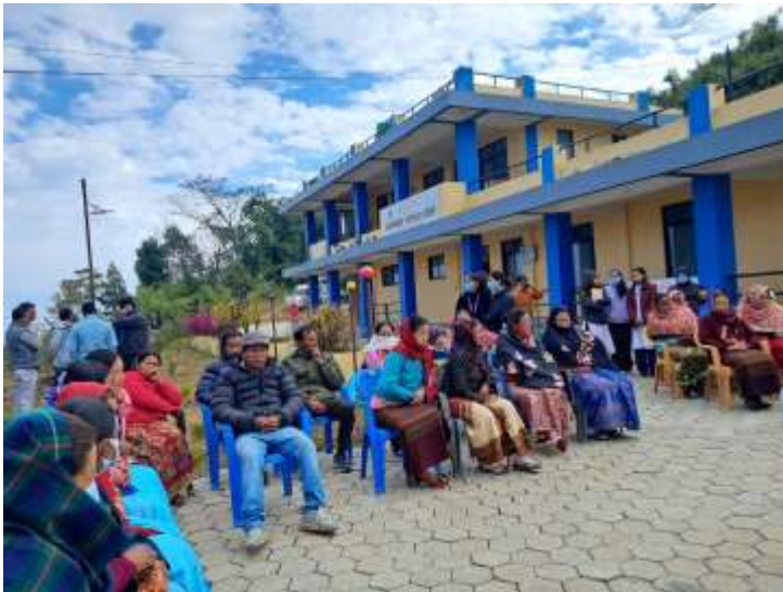
हेल्थ क्याम्प @ माझकोट स्वास्थ्य चौकी

भंगरा स्वास्थ्य चौकी, पर्वतको आयोजनामा आ.ब २०८०/८१ को पहिलो चरणमा फलेवास न.पा. वडा न. ९, भंगरामा रहेको श्री ग्रामोदय मा.बि., श्री लिमी उल्लेरी आधारभुत विद्यालय, श्री शारदा प्रा.बि., श्री भवानी प्रा.वि.मा रहेको ५ वर्ष माथिका विद्यार्थीहरू र शिक्षक शिक्षिकाहरूलाई जुका संक्रमण नियन्त्रणको लागि अर्धवार्षिक जुकाको औषधि खुवाउने कार्यक्रम सम्पन्न भएको छ।