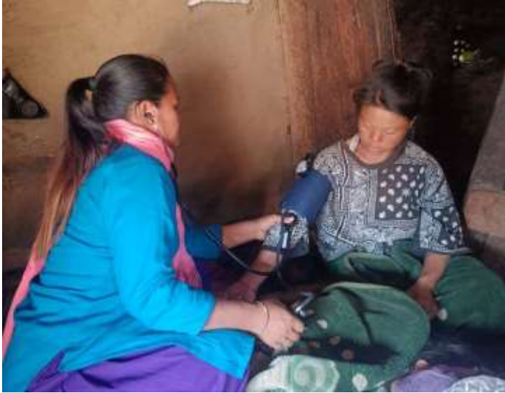
३ दिनको सुत्केरी घरभेट @ आधारभुत स्वास्थ्य सेवा केन्द्र बडिगाड १० दर्लिङ, बागलुंग

अंक १७०, वर्ष ५, २०८० मङ्सिर २४, December 10, 2023 आइतबार